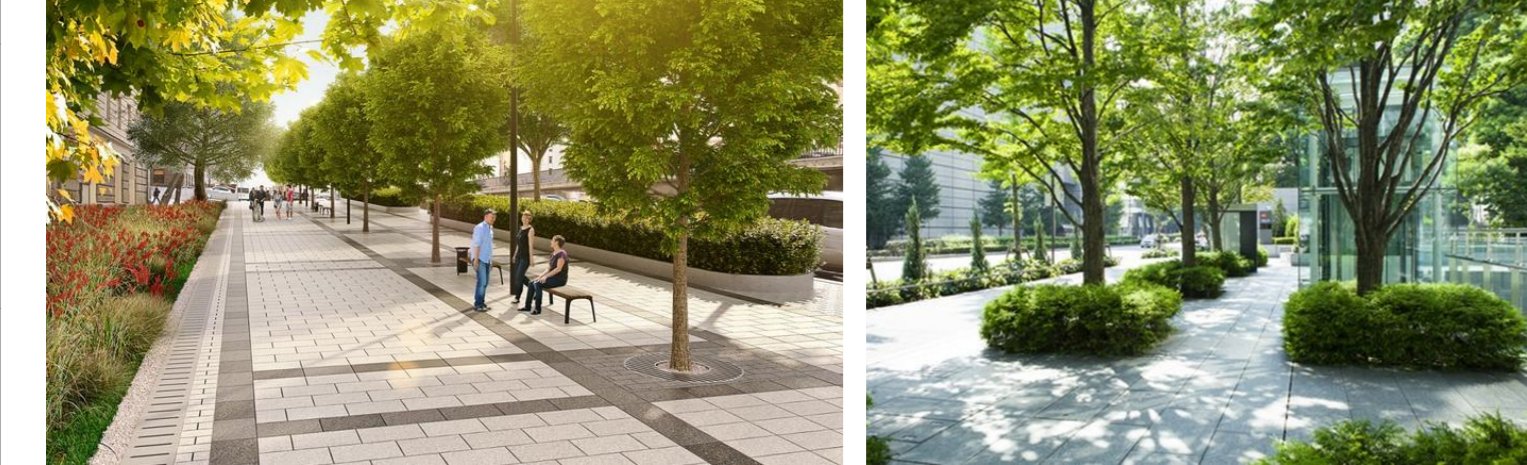
Реконструкция бульвара_ Пример: проект и фото _strelka